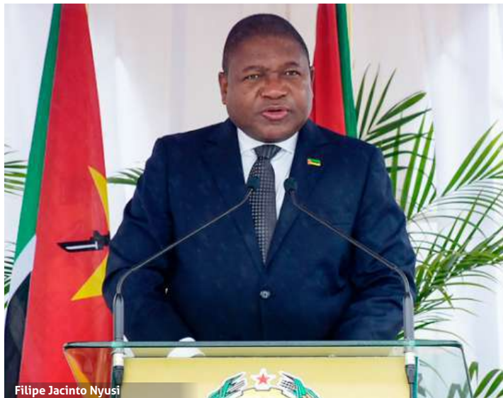
Filipe Jacinto Nyusi

O Presidente da República, Filipe Jacinto Nyusi , apontou as incursões armadas de activistas de inspiração jihadistas no Norte como uma ameaça real à soberania, no dia em que o país