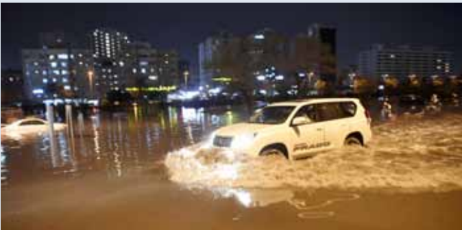
تكرار الغرق يتطلب معالجة عاجلة (أرشيفية)

ونص القرار على التحقيق في أسباب التأخير في معالجة تنفيذ ما ورد بتقارير اللجان المشكلة في أسباب تجمع المياه وطفح للصرف الصحي والقصور والإهمال وضعف الإشراف والرقابة على تنفيذ العقود وتحديد المنسب بتأخير معالجة ذلك. كما نص القرار على التحقيق في أسباب التأخير في طرح عقود الصيانة للمناطق الداخلية والطرق الرئيسية وتحديد المنسب في تأخير تلك العقود.