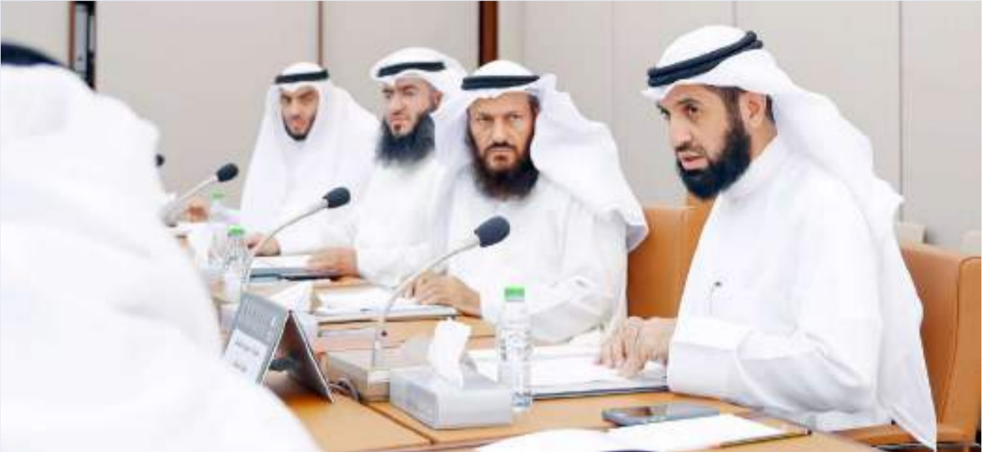
أعضاء لجنة الظواهر السلبية خلال اجتماعها أمس

عقدت لجنة القيم والظواهر السلبية اجتماعاً أمس، لمناقشة تكليف المجلس لها ببحث ودراسة قضايا المخدرات والتفكك الأسري والرشوة والغش والواسطة.