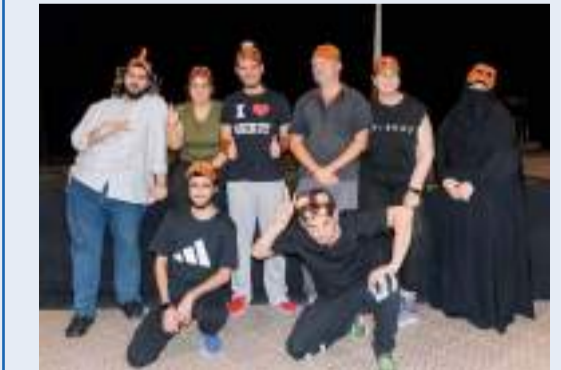
جانب من العرض المسرحي

وشغفهم وحماسهم، كما التزامهم بكل الجلسات التدريبية. لقد جسدت الورشة حقيقة رغبتهم ونوفهم للتمثيل، فكان أن بذلوا جهوداً جبارة وأبدوا تصميمهم على إتقان الأداء المسرحي بأعلى درجات المهنية والإنسانية، متجاوزين الصعاب والتحديات، أملاً أن تكون هذه الورشة خطوة نحو ورش أخرى تتيح المجال أمام المزيد من التطور والتقدم.