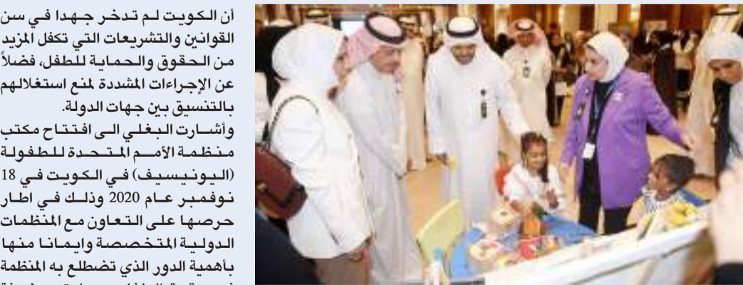
جانب من الاحتفال باليوم العالمي للطفل

أن الكويت لم تدخر جهداً في سن القوانين والتشريعات التي تكفل المزيد من الحقوق والحماية للطفل، فضلاً عن الإجراءات المشددة لمنع استغلالهم بالتنسيق بين جهات الدولة. وأشارت البغلي إلى افتتاح مكتب منظمة الأمم المتحدة للطفولة (اليونيسيف) في الكويت في 18 نوفمبر عام 2020 وذلك في إطار حرصها على التعاون مع المنظمات الدولية المتخصصة وإيماناً منها بأهمية الدور الذي تضطلع به المنظمة في حقوق الطفل وحمايته، مضيفة أن الكويت تعد من إحدى أكبر الدول الداعمة للمنظمة.