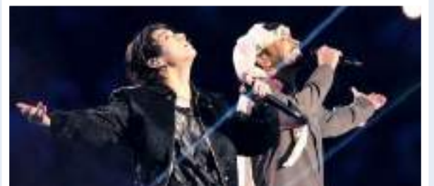
نجم البوب الكوري جونتوكوك والفنان القطري فهد الكبيسي