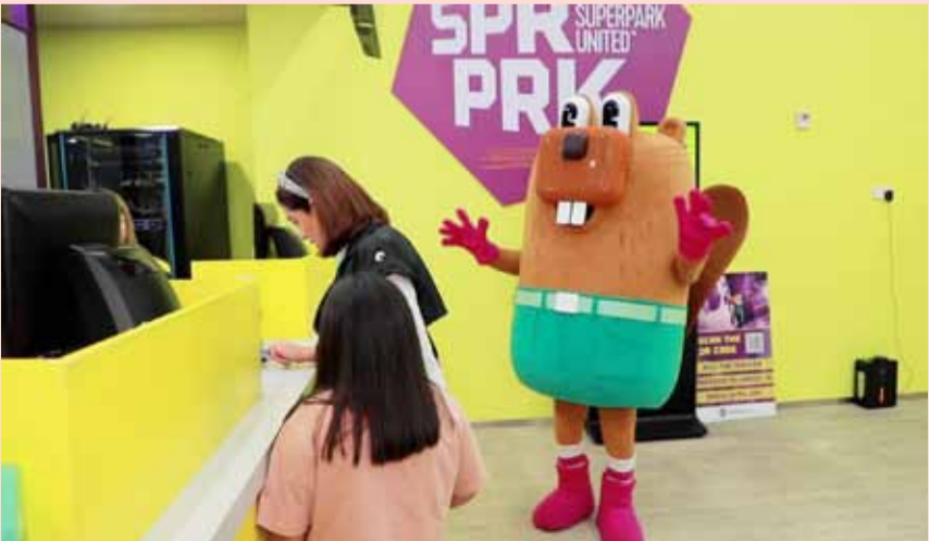
سوبربارك من أفضل الأماكن للهو الأطفال

أعلنت شركة سوبربارك عن افتتاح مركز سوبربارك الترفيهي لألعاب الأطفال الأول من نوعه في الكويت والشرق الأوسط، المركز الترفيهي الجديد يقع في الأفنيوز بوابة 16 ميراثين. ويتميز سوبربارك بكونه وكالة عالمية فنلندية، حيث تعتبر فنلندا الدولة الاسكندنافية التي تسعى جاهدة عبر قوانينها وممارساتها وتشريعاتها الى الاهتمام بالأطفال. ومن هنا يمكننا القول إن جميع الألعاب الموجودة في سوبربارك هي ألعاب هادفة ومميّزة ومفيدة للأطفال. ومن الألعاب الحركية المتخصصة بالترفيه، لعبة التسلق claiming ولعبة الترامبولين، وهي ألعاب تحدي مناسبة لجميع الفئات والأعمار، كذلك لعبة كرة القدم وكرة السلة، إضافة الى مجموعة متكاملة ومتنوعة من الألعاب الهادفة والمسلية، وكل هذه الألعاب بأسعار مناسبة جداً ولا تتخلل كاهل ميزانية الأسر.