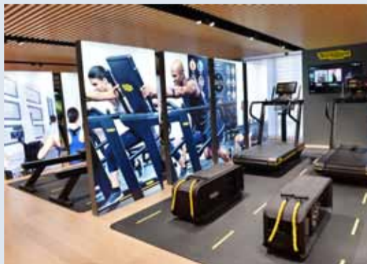
مجموعة من أجهزة تكنوجيم

حلول النوادي والمراكز الرياضية والتأهيل الطبي، وفيه يتمكن الزائر من تجربة الأجهزة واختيار الأنسب حسب الرغبة. كما توفر شركة Technogym الكويت من خلال أجهزتها أحدث وأسهل البرامج، التي تسمح لمستخدميها بالتدريب مع أشهر المدربين العالميين. وتتميز Technogym، الشركة الرائدة في العالم في مجال المعدات الرياضية، بتصميمها الإيطالي المبتكر، والتكنولوجيا المتطورة، والجودة العالية، والمنتجات السهلة الاستخدام.