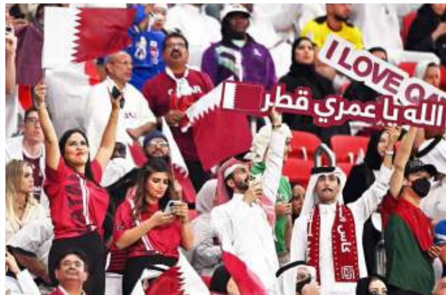
الجماهير القطرية حاضرة بقوة