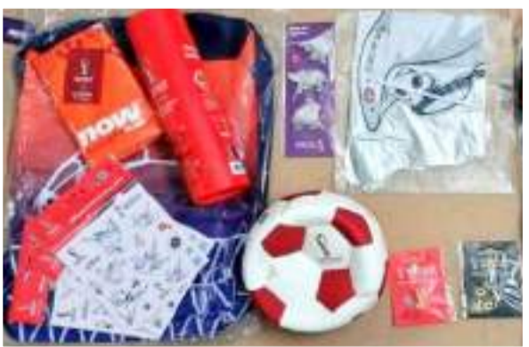
توزيع الهدايا على الجماهير

خسر المنتخب القطري الاول لكرة القدم أولى مبارياته بكأس العالم 2022 التي انطلقت في الدوحة، والتي جاءت على يد منتخب الإكوادور بهدفين لاشيء في المواجهة التي جمعتهما ضمن لقاءات المجموعة الاولى، في انطلاق منافسات المونديال وجاء هدفا اللقاء عبر مهاجم