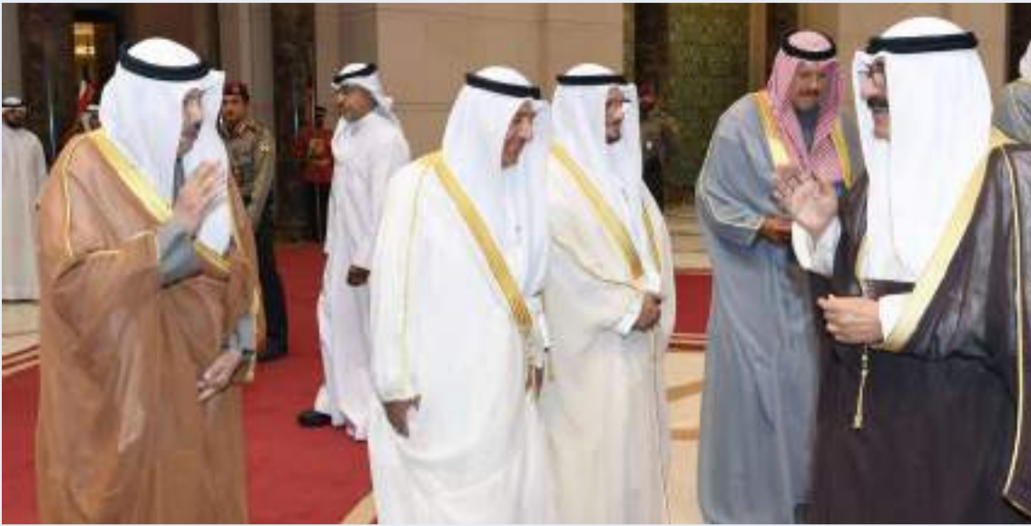
..ومودعا كبار رجال الدولة