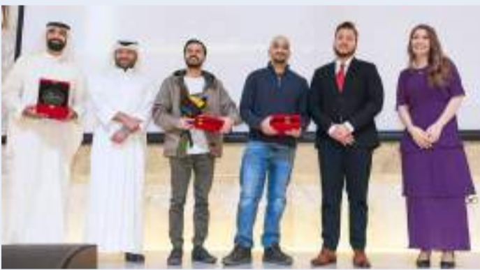
تكريم الفائزين في المهرجان السينمائي

أكدت وزيرة الشؤون الاجتماعية والتنمية المجتمعية وزيرة الدولة لشؤون المرأة والطفولة المهندسة مي البغلي أمس (الأحد) حرص الكويت على تعزيز حقوق الطفل وحمايته وصون كرامته انطلاقاً من مبادئها الدستورية وتشريعاتها الوطنية والزاماتها الدولية. وقالت البغلي في كلمتها باحتفالية أقامتها وزارة الشؤون الاجتماعية بمناسبة اليوم العالمي للطفل تحت شعار «كويت جديدة من أجل أطفالنا»، إن الكويت أدركت أن مرحلة الطفولة من أهم مراحل نمو الإنسان، فعملت على تسخير كل الإمكانيات للطفل ونذلت مختلف العوائق ومهدت لهم شتى الطرق، معلنة عن منظومة تشريعية متكاملة لحماية حقوق الطفل. وأوضحت أن السياسات الحكومية تسير وفق منهجية تركز على الجوانب