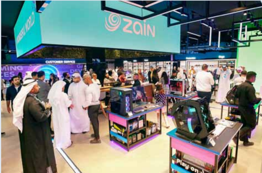
«زين ميغاستور» أحدث وأكبر فروع الشركة في الكويت