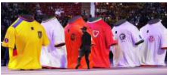
جانب من حفل الافتتاح