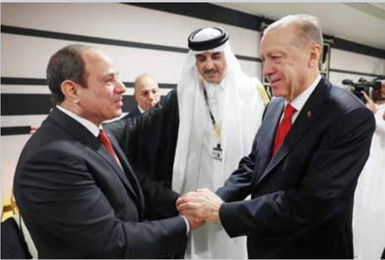
أردوغان والسياسي خلال المصافحة.. ويتوسطهما أمير قطر

على هامش افتتاح مونديل قطر 2022، التقى الرئيس التركي رجب طيب أردوغان، للمرة الأولى منذ سنوات، الرئيس المصري عبدالفتاح السيسي، في العاصمة القطرية الدوحة، خلال حضور الزعيمين افتتاح كأس العالم. وقد صافح الرئيس المصري نظيره التركي بحضور أمير قطر الشيخ تميم بن حمد. كما شهدت المقصورة الرئيسية لاستاد البيت، الذي يحتضن فعاليات افتتاح