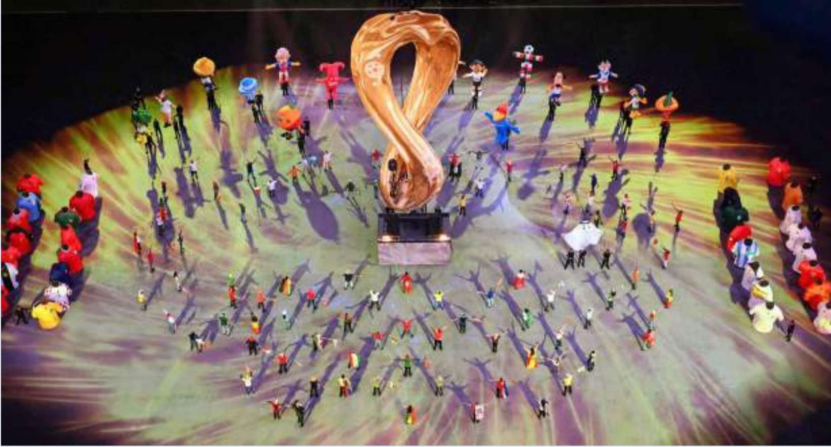
لوحة فنية لافتة للأنظار في حفل الافتتاح