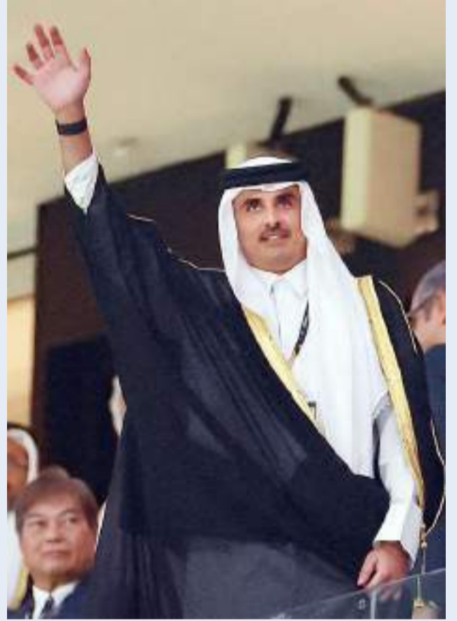
أمير قطر محبياً الحضور