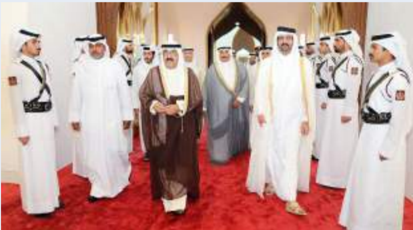
ممثل الأمير لدى وصوله إلى قطر وفي استقباله نائب أمير قطر

على استاد البيت في مدينة الخور بدولة قطر الشقيقة. وكان في مقدمة مستقبلي سموه على أرض المطار لدى وصوله إلى الدوحة نائب أمير دولة قطر الشقيقة الشيخ عبدالله بن حمد بن خليفة آل ثاني، كما كان في استقبال سموه سفير الكويت في قطر خالد المطيري. وكان في وداع سموه على أرض المطار لدى مغادرته البلاد، رئيس مجلس الأمة أحمد السعدون، وسمو الشيخ ناصر المحمد، ورئيس ديوان سمو ولي العهد الشيخ أحمد عبدالله، وسمو الشيخ صباح الخالد، ورئيس مجلس الوزراء سمو الشيخ أحمد نواف الأحمد الصباح، ونائب رئيس الحرس الوطني الشيخ فيصل النواف، ووزير شؤون الديوان الأميري الشيخ محمد عبدالله وكبار المسؤولين بالدولة وسفير قطر الشقيقة لدى البلاد علي بن عبدالله زيد آل محمود. ورافق سموه وفد رسمي ضم كلا من الشيخ فهد سعد عبدالله، ووزير الإعلام والثقافة وزير الدولة لشؤون الشباب عبدالرحمن المطيري، ورئيس اللجنة الأولمبية الكويتية الشيخ فهد ناصر صباح الأحمد، وكبار المسؤولين بديوان سمو ولي العهد.